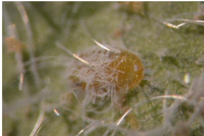
Figura 1. Pupa del cuarto instar de Paraleyrodes minei en Ficus benjamina colectada en el estado de Puebla.

Como todos los Aleurodicine, el dorso de la pupa posee poros grandes compuestos alineados a lo largo del submargen (Fig. 1). Además, la línula exertada del orificio baciforme. La variación en el tamaño y la morfología interna de los poros compuestos (Figs. 2 y 3), es notable en las especies de Paraleyrodes , y son útiles en la identificación provisional de especies cuando los machos adultos no están presentes.